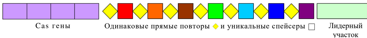
Рис. 1. Упрощенная схема организации функционального CRISPR-локуса (масштаб не соблюден)

Цифровые данные о содержании в известных геномах микроорганизмов CRISPR-локусов по